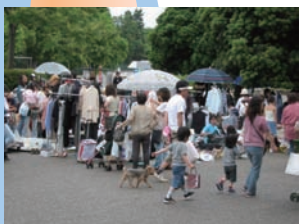
久宝寺緑地で不定期に行われるリサイクルフェア。出店を覗いたり掘り出し物を探したりと、人とのふれあいでもエコライフが楽しめる。

古着や余り布がオシャレに変身！ おおきな事じゃなくても、身近なところからエコライフ！ これなら、私も明日からさっそく始められよう！